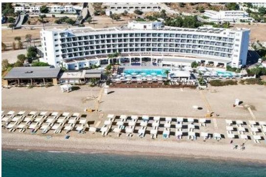
Hotel TUI BLUE Lindos Bay