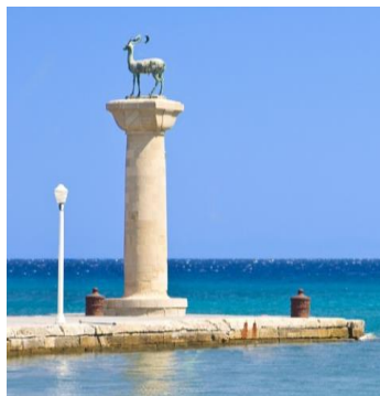
Der Hirsch am Hafen von Rhodos