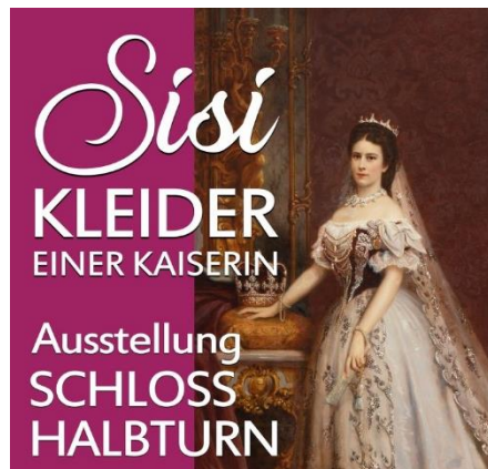
Ausstellung „Sisi“ im Schloss Halbturn

14.07.2022: Busfahrt von Bamberg bzw. Forchheim um ca. 07.00 Uhr nach Illmitz am Neusiedler See. Ankunft im Hotel „Nationalpark“ in Illmitz gegen 16.30 Uhr, Zimmervergabe. Der spätere Nachmittag ist zur freien Verfügung. Abendessen und Übernachtung im Hotel.