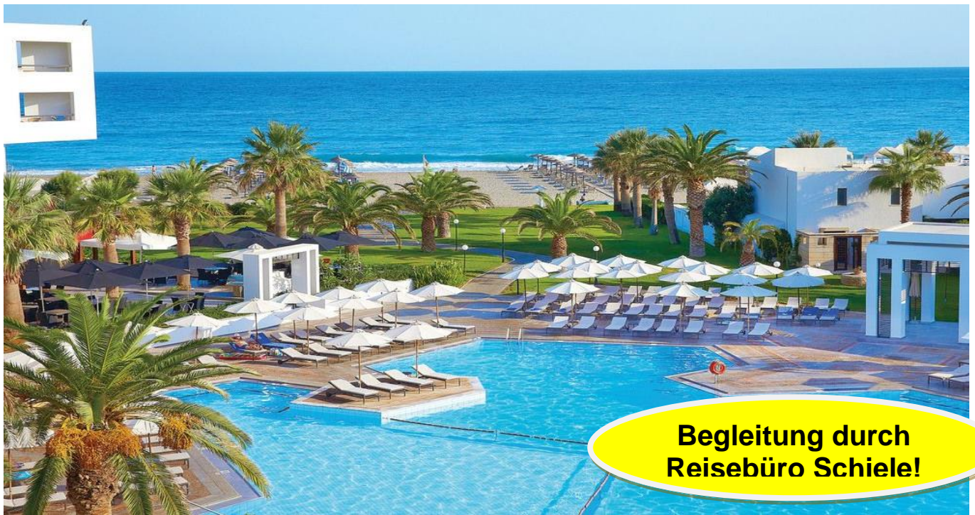
Fünf-Sterne Grecotel „Creta Palace“, Rethymnon

Kreta ist die größte griechische Insel und mit rund 8261 Quadratkilometern Fläche sowie 1066 Kilometern Küstenlänge nach Sizilien, Sardinien, Zypern und Korsika die fünftgrößte Insel im Mittelmeer. Kreta zählt zur gleichnamigen griechischen Region Kreta. Wenn man Kreta kennen- und lieben lernen will, dürfen dabei nicht fehlen: Die malerischen Hafenstädte Chania und Rethymnon, die minoischen Paläste von Knossos und Phaestos. Kontraste begegnen uns in Kreta zwischen unsren schönen Badehotels einerseits und den einsamen Landschaften und Klöstern im Landesinneren andererseits. Tauchen Sie auf Märkten und in Straßencafés in das griechische Alltagsleben ein. Lernen Sie aber auch die kretische Küche während Ihres Aufenthaltes kennen.