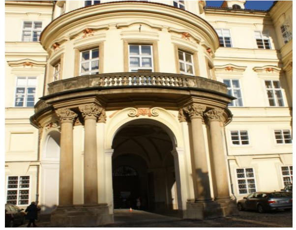
Historischer Balkon in der Deutschen Botschaft in Prag