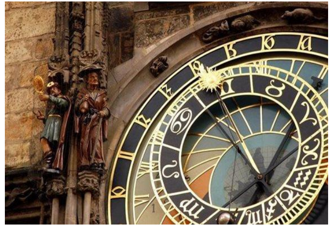
Die Astronomische Uhr am Altstädter Rathaus