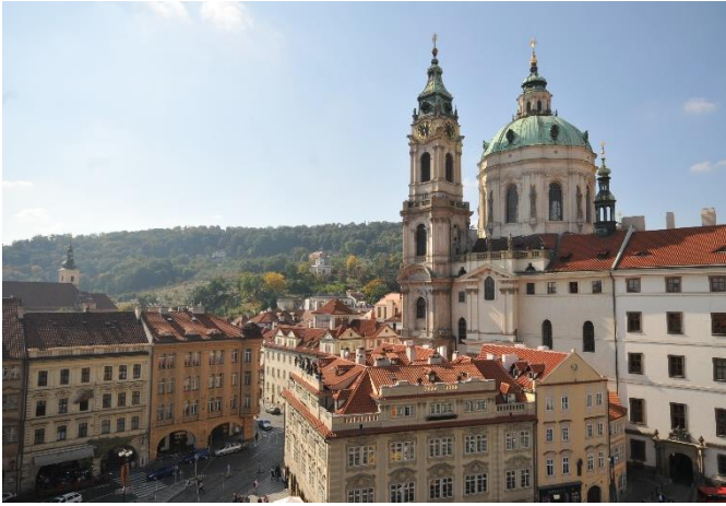
Blick auf die Nikolauskirche am Kleinseitner Ring