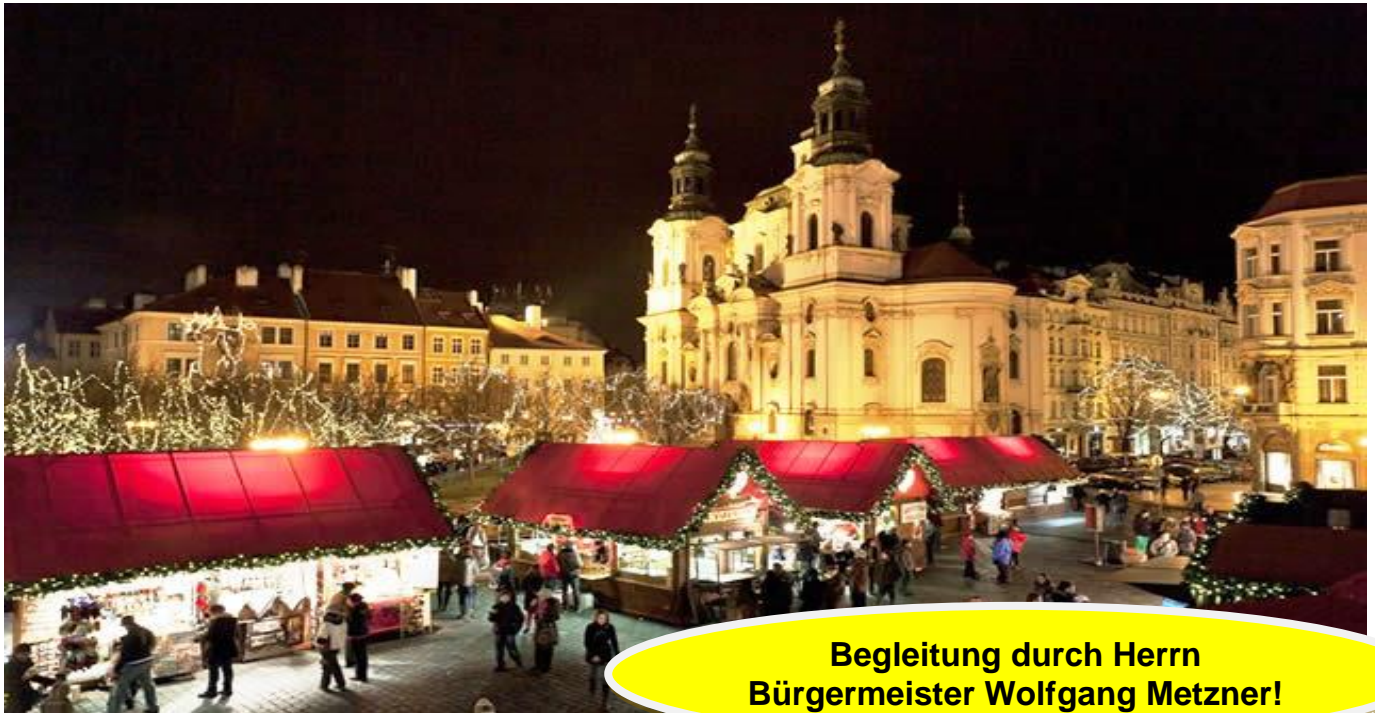
St.-Niklas-Kirche mit Weihnachtsmarkt am Altstädter Ring

Anlässlich der 25-jährigen Städtepartnerschaft zwischen Bamberg und Stadtbezirk Prag 1 laden wir Sie ein, die Vorweihnachtszeit in unserer Partnerstadt Prag zu verbringen. Die Weihnachtsmärkte der Stadt gehören zu den schönsten von ganz Europa. An den kleinen Holzständen werden u.a. böhmische Souvenirs, traditionelle Weihnachtsdekorationen, keramische Krüge, Holzspielzeuge, Marionetten und Artikel aus böhmischem Glas präsentiert. Besonders hervorzuheben auf den Weihnachtsmärkten sind die kulinarischen Genüsse, die ebenso wie das Kunsthandwerk alte Weihnachtstraditionen wiederbeleben. Eine wunderschöne Zeit! Das abwechslungsreiche Kulturprogramm bei dieser Bürgerreise sorgt für unvergessliche Erinnerungen.