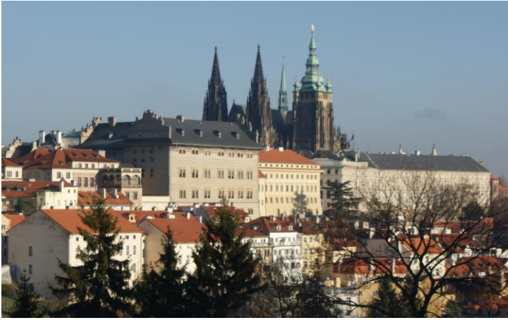
Blick zum St. Veitsdom von Prag