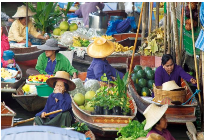
Schwimmender Markt in Bangkok

Abendessen und Übernachtung/Frühstück im 4-Sterne-Hotel Laluna in Chiang Rai