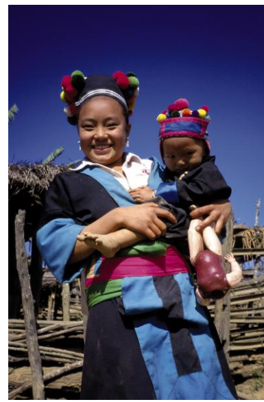
Mutter mit Kind in Nord-Thailand