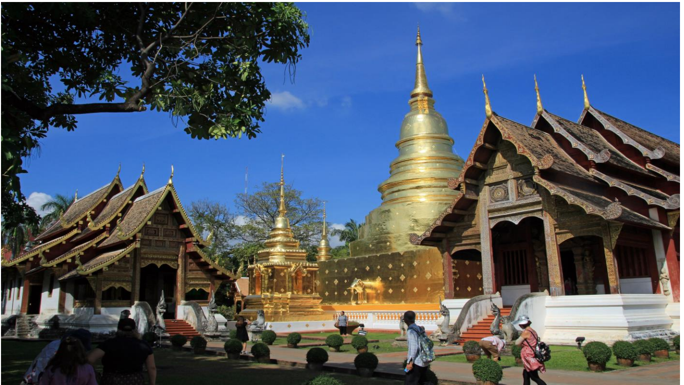
Glitzernder kunstvoller buddhistischer Tempel Wat Phra Singh in Chiang Mai

Thailand ist ein wundervolles Reiseland, ein uraltes Königreich mit Hunderten von buddhistischen Tempeln, Tausenden kleinen Dörfern und Millionen fröhlicher und gastfreundlicher Einwohner. Unsere Reise beginnt mit einer ausführlichen Stadtrundfahrt in der Hauptstadt Bangkok und führt uns zu den meistverehrten Kunstschätzen Thailands, wie z. B. dem bekannten Tempel Wat Arun, zur größten Klosteranlage Wat Pho und zum Königspalast Wat Phra Kaeo. Auf unserer Reise sehen Sie die UNESCO-Weltkulturerbestätten Ayutthaya (Tempelruinen) und den Historischen Park von Alt-Sukhothai. Auch eine Bootsfahrt auf dem Mekong darf nicht fehlen, ebenso erleben Sie die berühmte Brücke am Kwai. Die erlebnisreiche Reise können Sie an den beiden freien Tagen im Vier-Sterne-Hotel „Baan Laksasubha“ an den kilometerlangen Sandstränden in Hua Hin ausklingen lassen.