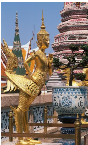
Wat Phra Kaew, Bangkok