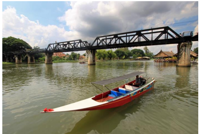
Brücke am River Kwai