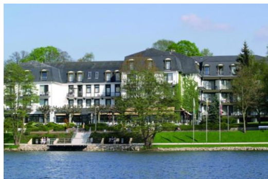
Hotel „Wyndham Garden“, Bad Malente

23.07.2018: Frühstück im Hotel. Auschecken und Verladung des Reisegepäcks. Am Vormittag Rückfahrt mit dem Omnibus nach Bamberg bzw. Forchheim. Unterwegs Zwischenstopp mit Mittagspause.