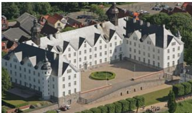
Schloss in Plön