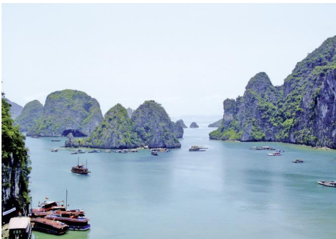
Halong - Bucht

Zusätzliche Mahlzeiten und jegliche Getränke, zusätzliche Transfers und Ausflüge, Early Check-In / Late Check-Out, persönliche Ausgaben, Trinkgelder für den Reiseleiter, Busfahrer und Gepäckträger, Reiseversicherungen und Reiserücktrittskostenversicherungen, alle nicht aufgeführten Leistungen.