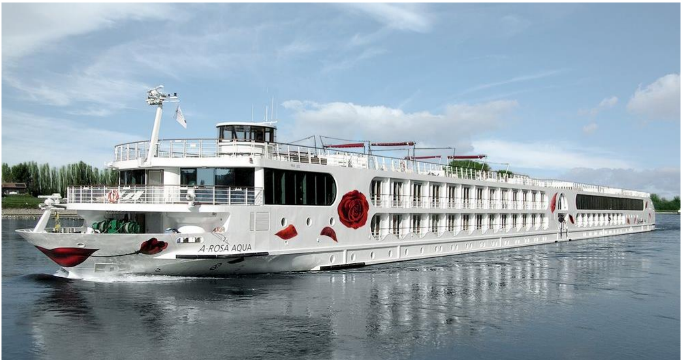
Flussschiff A-ROSA AQUA

Was für ein Schlussakkord des mächtigen Rheins! Bevor er sich mit der Nordsee vereint, teilt er sich in fünf Arme und zieht sich wie ein gewaltiger Fächer durch die unberührte Natur. Er hat es nun eilig, seine berühmten Städte mit all ihren Menschen, ihrer Kultur, ihren Museen und den großartigen Bauten hinter sich zu lassen. Man atmet durch in dieser unvergleichlichen Luft und kann ihn ein wenig verstehen. Der Wind pfeift einem um die Nase – und sind das da hinten Seehunde? Ein unvergleichliches Gefühl von Freiheit breitet sich aus. Und dann wieder erfreut es doch das Auge, eins der altholländischen Fischerdörfer mit den urigen Treppengiebeln und den bunten Kuttern zu erblicken. Lassen Sie sich von diesem faszinierenden Reiseklassiker gefangen nehmen.