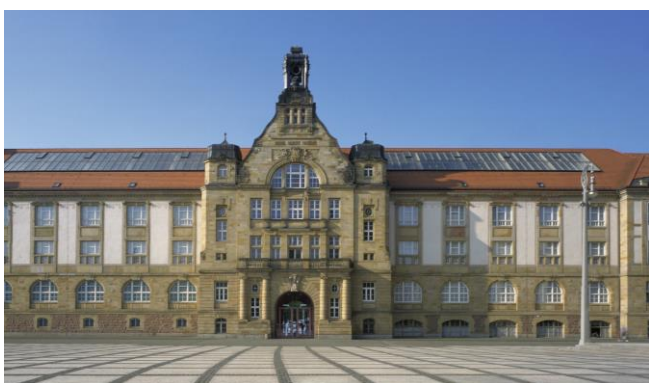
Kunstsammlung in Chemnitz

Am Freitag, 30. November 2018, unternehmen wir mit dem Bus einen Ausflug nach Annaberg-Buchholz. Eineinhalbstündige Stadtführung mit Besichtigung der Bergkirche St. Marien. Führung in der wunderschönen St. Annen-Kirche mit einem Orgelspiel. Danach gemeinsames Mittagessen im Ratskeller "Zum Neinerlaa" in Annaberg-Buchholz. Gelegenheit zum Besuch des Erzgebirgsmuseums und des Weihnachtsmarktes. Gegen Abend Rückfahrt zum Hotel nach Chemnitz.