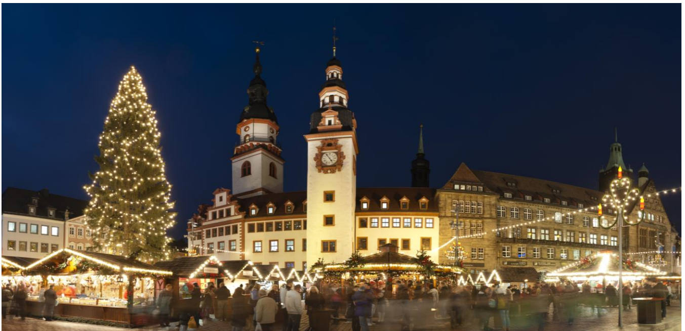
Blick auf den Weihnachtsmarkt mit dem Alten Rathaus von Chemnitz

Gekrönt von der berühmten St. Annen-Kirche lädt der Annaberger Weihnachtsmarkt im Herzen der Altstadt die Besucher ein. Er ist einer der schönsten Weihnachtsmärkte in Deutschland. Mit dem Anschieben der Pyramide wird der Weihnachtsmarkt am 30. November 2018 eröffnet. Das Programm des Ausfluges nach Annaberg-Buchholz finden Sie auf der Rückseite des Prospektes.