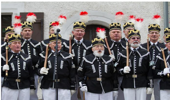
Große Bergparade in Chemnitz