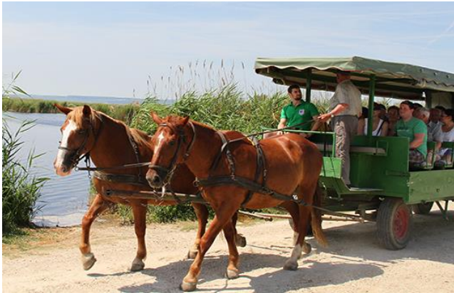
Kutschenfahrt in Illmitz am Neusiedler See