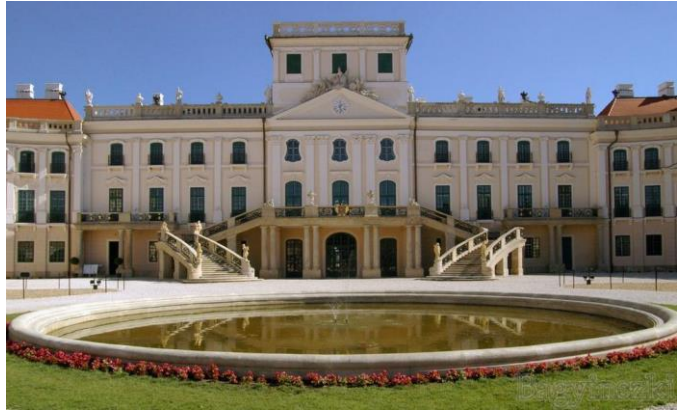
Schloss Eszterhaza in Fertöd, Ungarn

20.07.2017: Busfahrt von Bamberg bzw. Forchheim um ca. 07.00 Uhr nach Illmitz am Neusiedler See. Ankunft im Hotel „Nationalpark“ in Illmitz gegen 16.00 Uhr, Zimmervergabe. Der Nachmittag ist zur freien Verfügung. Abendessen und Übernachtung im Hotel.